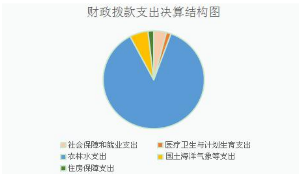
财政拨款支出决算结构图