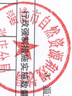
淄博市自然资源和规划局张店分局（单位）2021年度行政强制措施统计表