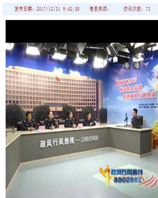
2017年12月16日淄博市公安局张店分局上线