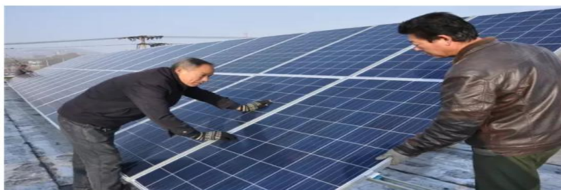
光伏发电项目带动贫困户脱贫

近年来，淄博市张店区始终把改善服务民生作为重中之重，不断强化群众导向，着力构建改善民生常态化工作机制，把保障和改善民生与转变政府职能、加强公共服务等紧密结合起来，坚持每年三分之二以上财力用于改善民生，全面落实各级惠民政策，通过大力实施一系列民生项目，提高了群众的满意度和幸福感，实现了向服务民生的战略性转移，初步形成了以服务民生为核心的全区工作新格局。2017年，全区计划实施31项区级民生项目，计划投资11.6亿元。